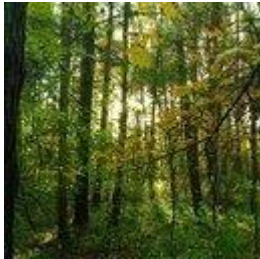
Лариса Полонская 1 авг. 2020 г.

Хватит уже разрушать город, превращая его в бетонного монстра!!!