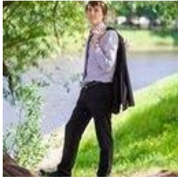
Сергей Белесев 4 недели назад