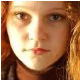
Полина Кац 4 недели назад

Я хочу сохранить аллею и парк в нашем районе.