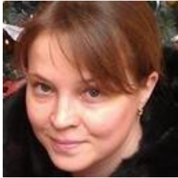
Софья Комарова 4 недели назад

Я подписываюсь, потому что данный проект не актуален для моего города.